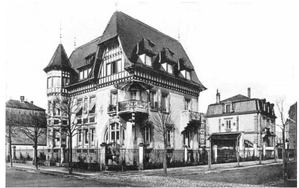
(Regio Consolato di Strasburgo)

Il Regio Consolato di Strasburgo di 1 a categoria e' stato istituito nel 1927 in sostituzione di quello di 2 a categoria (onorario) nella cui giurisdizione consolare di competenza, vi era anche il Territorio di Belfort.