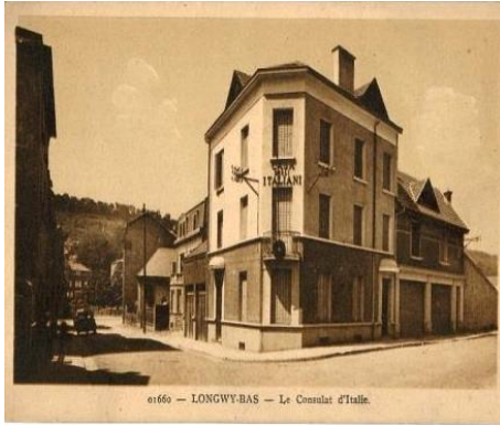
(Regio Consolato di Longwy)

Durante gli anni '30, in Lorena, esistevano altri due vice consolati, a Briey e a Longwy, ed un Regio Consolato a Reims, nella regione Champagne-Ardenne.