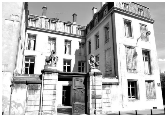
(prima sede del Regio Consolato d'Italia a Nancy)

Un Consolato in Mulhouse fu istituito con Regio Decreto in data 30/07/1864.